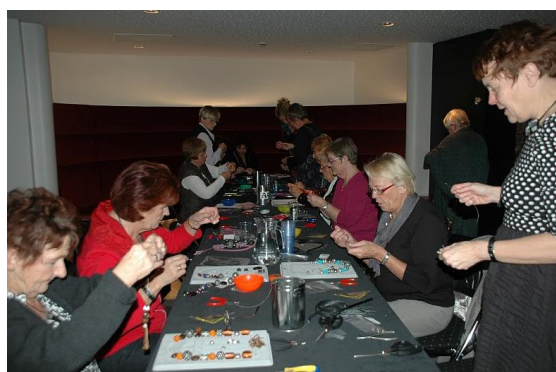
Workshop sierraden maken